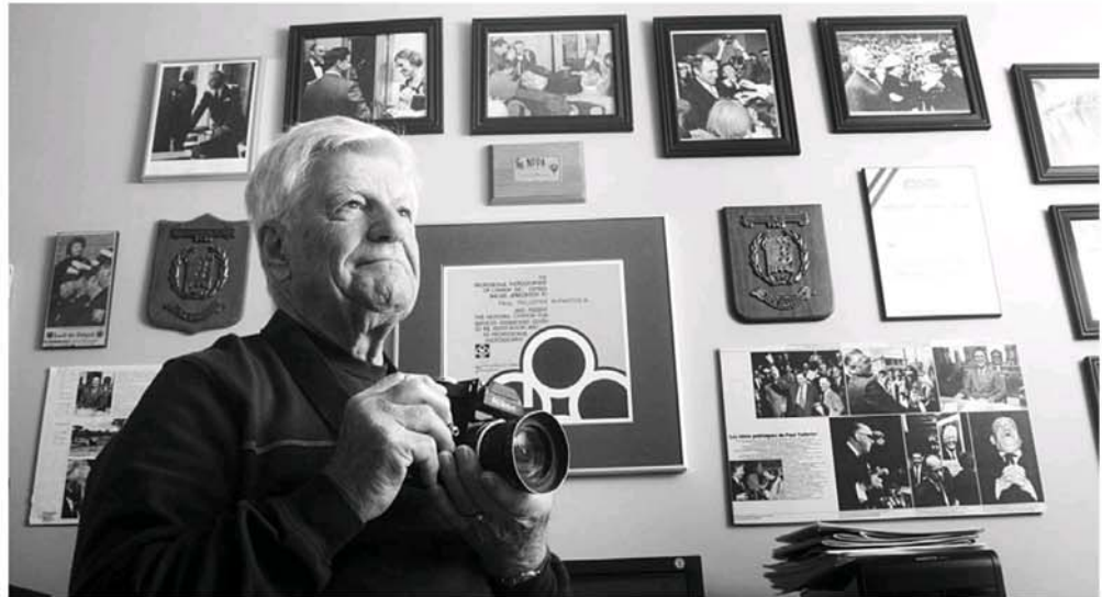
Le maître photographe Paul Taillefer a été l'œil du Droit pendant des décennies. Il a été le témoin privilégié de plusieurs grands moments de l'histoire.

en action (REA), un organisme pour les retraités de la région, qu'il partage sa passion pour la photographie.